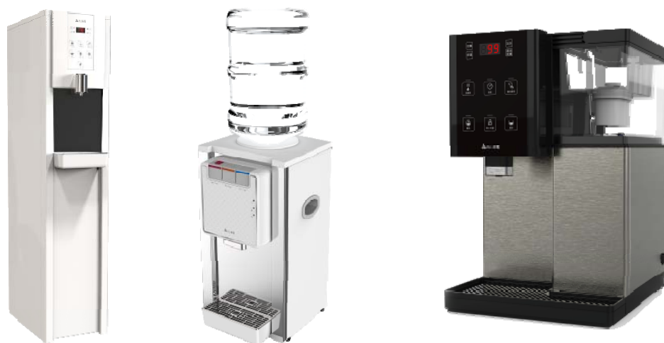
圖一、飲水機款式(落地式飲水機/桶裝飲水機/家用開飲機)